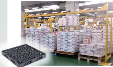
■ パレット対応品の例