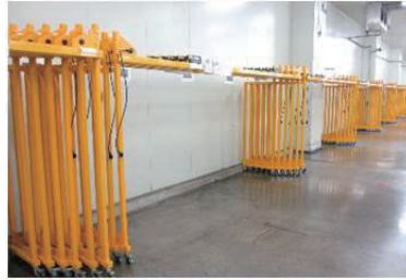
■ ラック連結イメージ