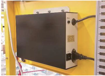
■ AC/DC コンバータ