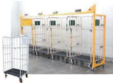
■ カゴ車対応品の例